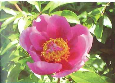
Rosa de albardeira