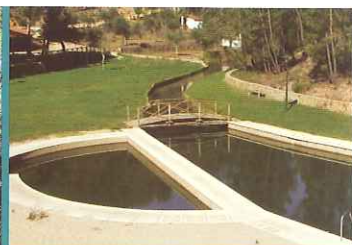
Praia Fluvial do Carvoeiro