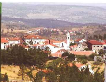
Vista de Envendos