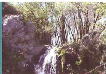
Pego da Rainha